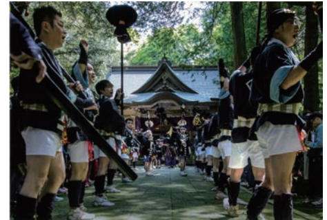
2019年度 日吉神社神幸神事保存会長賞「意気込み」 撮影場所 / 日吉神社