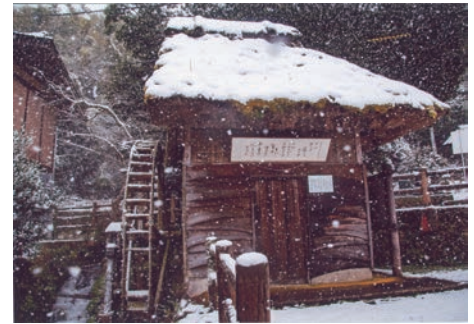
2022年度 優秀賞「雪の真名井」 撮影場所 / 天の真名井